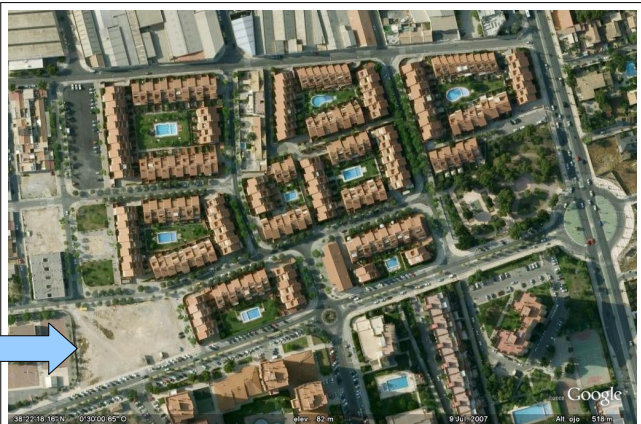
Plano de situación del solar indicado en el barrio Haygón 2