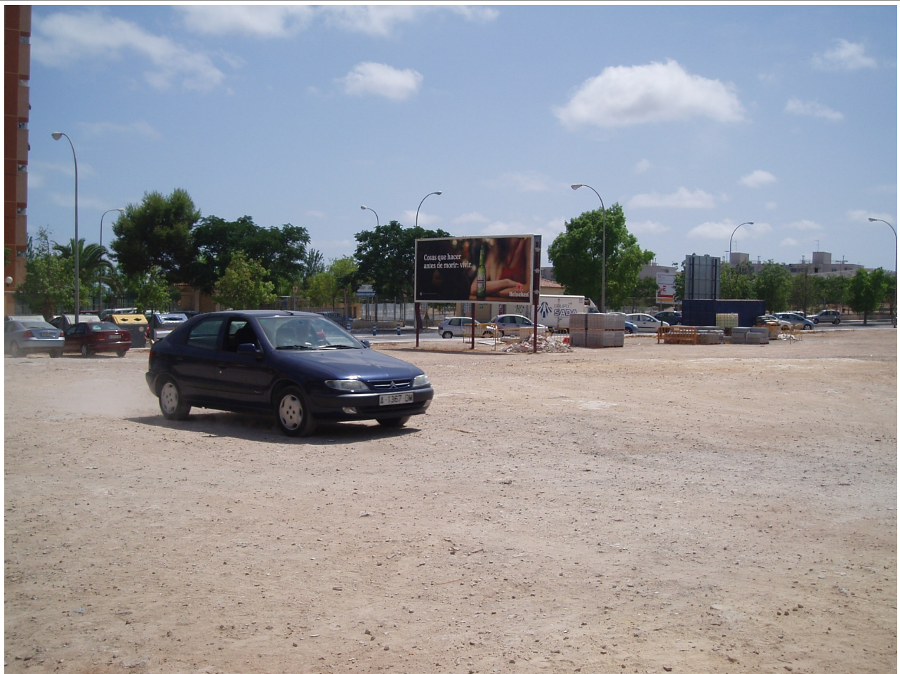
Estado del solar situado junto al CEIP Eusebio Sempere